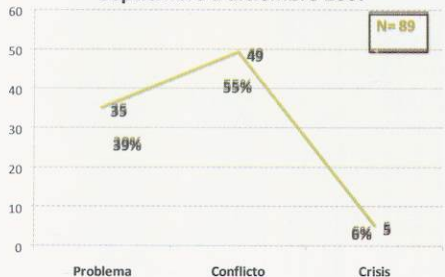
Gráfico No. 2 Fases de la conflictividad en número de casos y porcentajes Septiembre a diciembre 2007

En el periodo que comprende este Tercer Informe, los conflictos de naturaleza laboral (demandas salariales, condiciones de trabajo, desalojo de vendedores ambulantes, reclamos de organización sindical, despidos indebidos, etc.) constituyeron el 40 % del total de conflictos registrados en el último cuatrimestre del año. Las demandas de carácter económico, político y social (demandas EPS), que se volvieron conflictos abiertos y públicos, sumaron otro 47%, mientras que los conflictos agrarios, ambientales y gremiales conformaron juntos el 13 % restante.