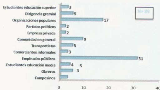
Gráfico No. 4 Actores demandantes en la conflictividad en número de casos Septiembre a diciembre 2007