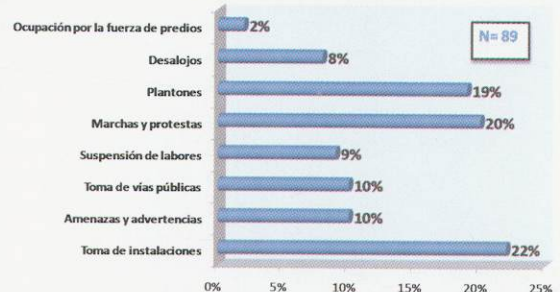
Gráfico No. 5 Formas de manifestación de conflictos en porcentajes Septiembre a diciembre 2007