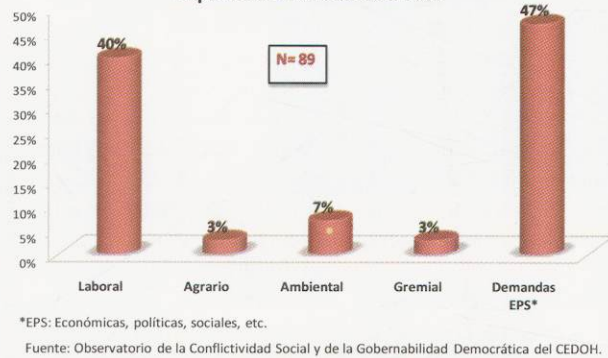
Gráfico No. 3 Conflictos por categorías en porcentajes Septiembre a diciembre 2007

En el apartado correspondiente a las demandas EPS quedan involucrados los conflictos más permanentes y reiterativos que se producen a diario en todo el país. Son aquellos que se derivan de reclamos comunitarios por la instalación de servicios básicos o por la mejoría de los mismos, construcción o reparación de carreteras, otorgamiento de títulos de propiedad, protección de los bosques y rechazo a la tala ilegal y a la deforestación, conservación de las fuentes de agua, prohibición de explotación minera que afecte el medio ambiente y la salud de los pobladores cercanos, resistencia organizada a los desalojos de predios o de vías públicas, exigencia de mayor fluidez y menos burocracia en los desembolsos de los dineros para financiar los proyectos de la ERP, etc. Es un conjunto de conflictos que refleja la complejidad del tejido social hondureño, la beligerancia creciente de los actores sociales y los mejores niveles de organización comunitaria que se observan en distintas regiones del país.